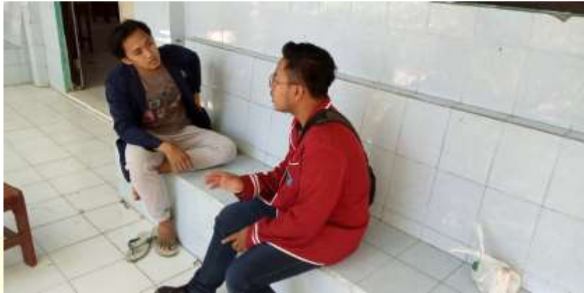
Wawancara kepada Ketua OSIS MAN 1 Probolinggo