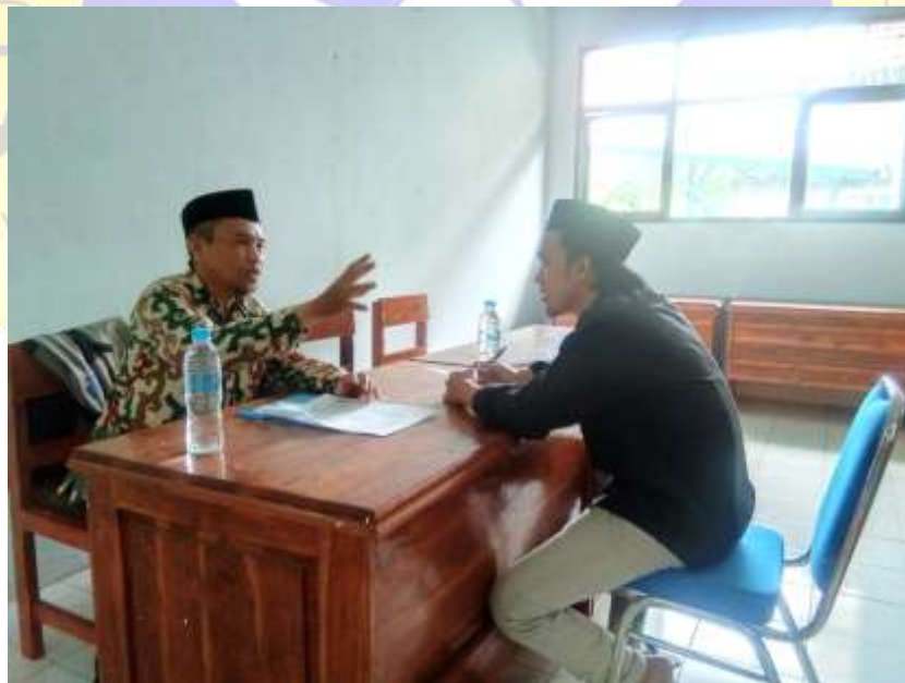
Wawancara kepada Ketua Penggerak Badan Keagamaan MAN 1 Probolinggo