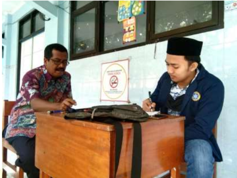
Wawancara kepada Wakil Ketua Penggerak Badan Keagamaan MAN 1 Probolinggo