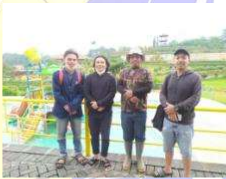
kegiatan wawancara dan dokumentasi lainnya