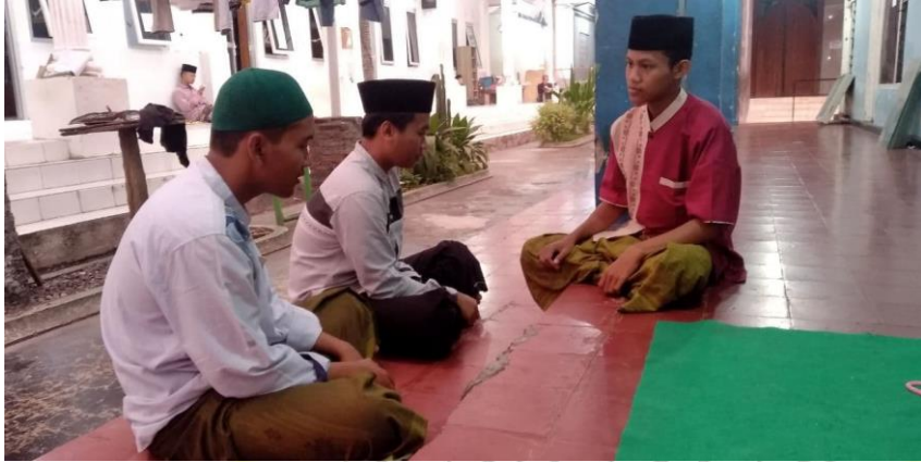
Bimbingan Wali Asuh kepada Anak Asuh kamar D. 09 Wilayah Sunan Kalijaga (D)