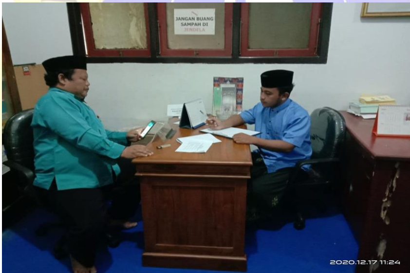
Wawancara dengan Sekretaris Biro Kepesantrenan Pondok Pesantren Nurul Jadid.