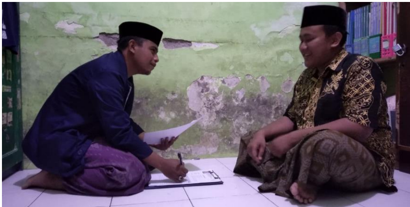
Wawancara dengan BK/WA Wilayah Sunan Kalijaga (D) Pondok Pesantren Nurul Jadid.