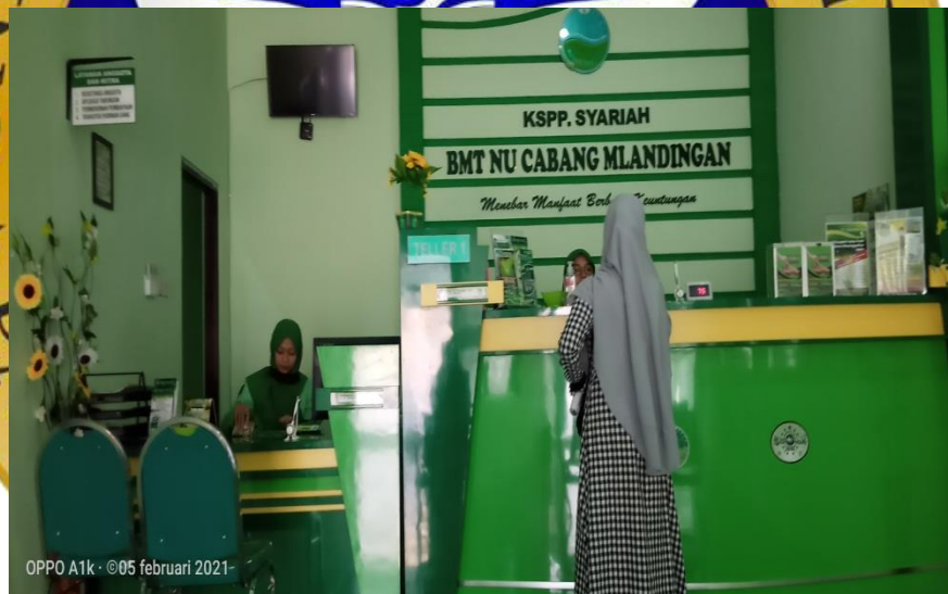
OPPO A1k · ©05 februari 2021