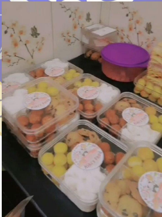
PENGEMASAN PRODUK YANG AKAN DIKIRIM