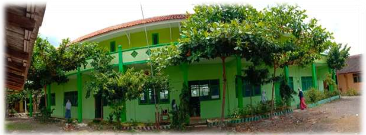
Gambar: Sekolah MA Sunan Kalijaga