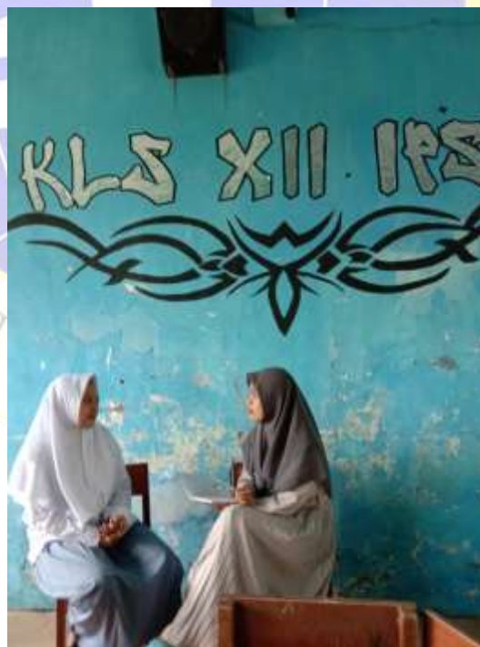
Gambar: Wawancara dengan Ketua Kelas XII