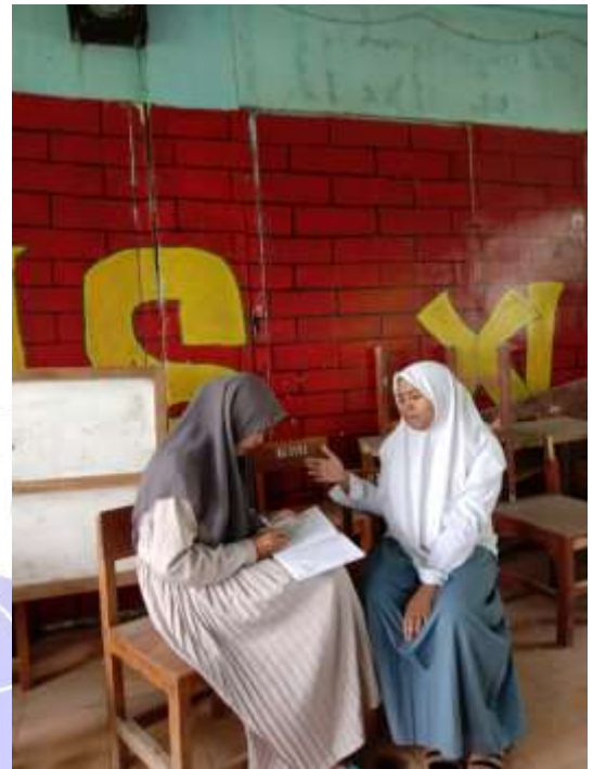
Gambar: Wawancara dengan Ketua Kelas X Gambar: Wawancara dengan Ketua Kelas XI