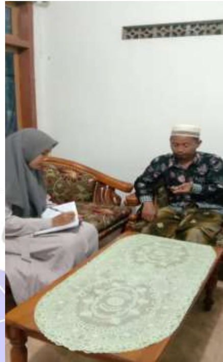
Gambar: Wawancara dengan Kepala Sekolah Gambar: Wawancara dengan Waka Kurikulum