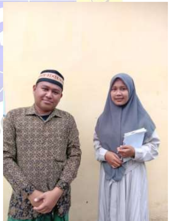
Gambar: Wawancara dengan Waka Kesiswaan Gambar: Wawancara dengan Waka Sarana