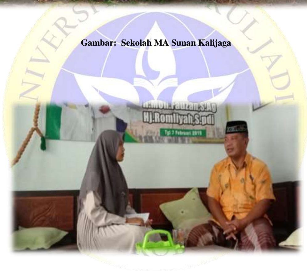
Gambar: Wawancara dengan Guru Al-Qur'an Hadits