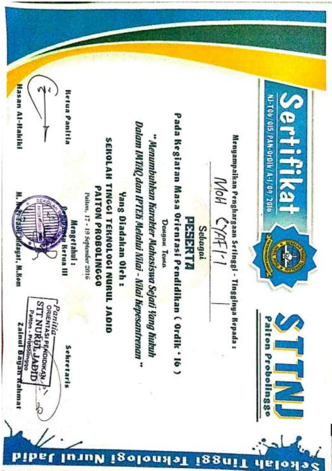
Lampiran 4. Sertifikat Ospektren