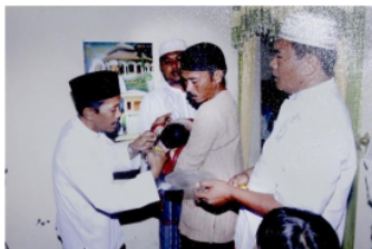
Gambar 4. Prosesi pengguntingan rambut

Gunting difungsikan untuk menggunting rambut si anak yang akan diakikah.