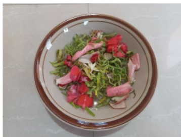
Gambar 3. Air bunga tujuh rupa

Air yang merupakan satu sumber kehidupan manusia ini bermakna sebagai gambaran hidup yang kemudian menyatu dengan sifat manusia, pada prosesi tersebut berharap agar si anak nantinya rejekinya lancar seperti air mengalir (Andi & Malla, 2021).