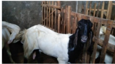
Gambar 1. Hewan akikah

Menyembelih kambing dalam prosesi akikah dilambangkan sebagai bentuk syukur atas lahirnya sang bayi serta bermakna melunasi hutang atau menebus anak yang dilahirkan. Untuk anak laki-laki dua kambing dan satu untuk anak perempuan.