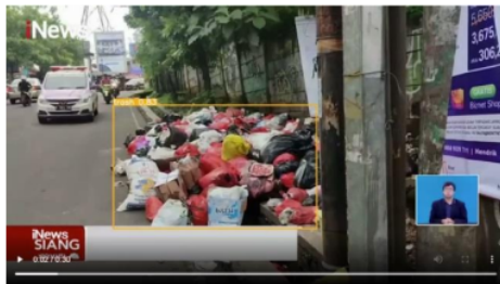
Gambar 3. Contoh Hasil Deteksi Sampah

Performa data training diuji memakai data validasi sejumlah 20 gambar menggunakan empat kelas, yaitu sampah, mobil, motor, dan orang. Tetapi meski 23 itu kelas yang digunakan hanya sampah, dikarenakan objek yang digunakan dalam penelitian ini adalah sampah, sedangkan kelas mobil, motor, dan orang di anotasi hanya agar tidak mengganggu proses pendeteksian sampah (agar tidak terdeteksi sampah).