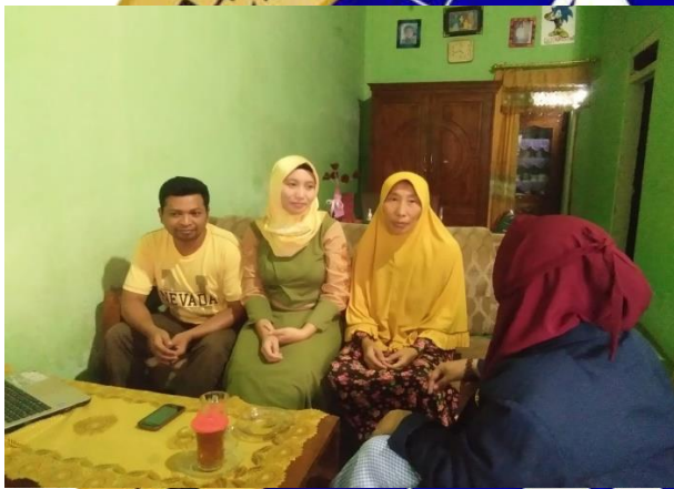
Proses wawancara kepada kepala sekolah