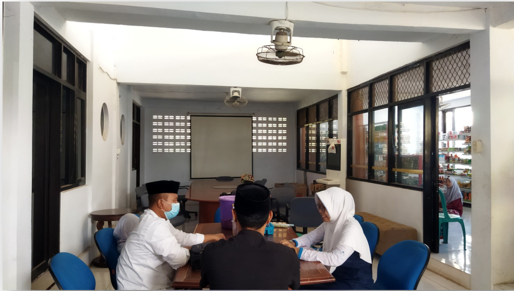
Gambar 3. Wawancara Bersama Salah Satu Konselor LMNJ dan Kabag. TU