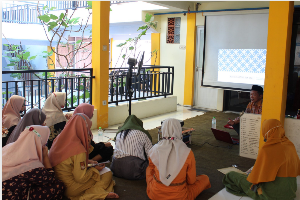
Gambar 1. Foto Layanan Kelas Literasi