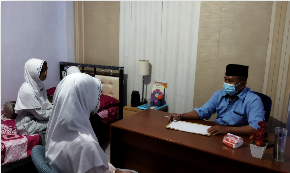
Gambar 2. Foto Layanan Kelas Konseling