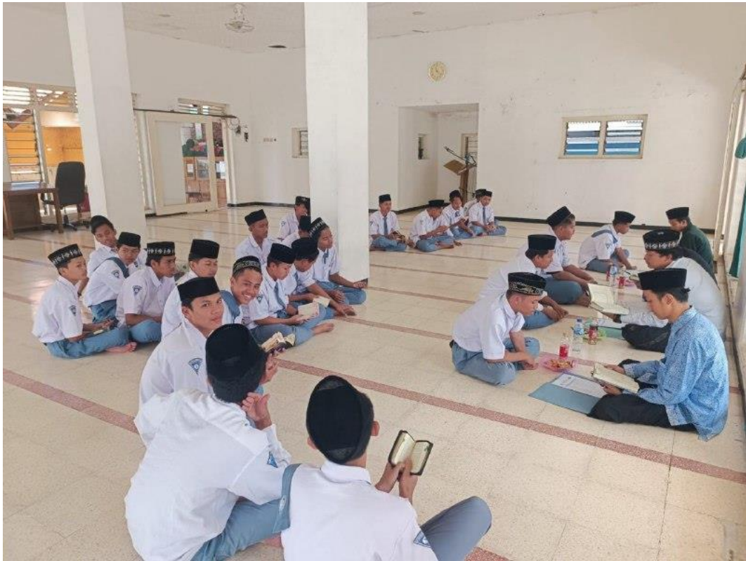
Dokumentasi kegiatan Muroja'ah