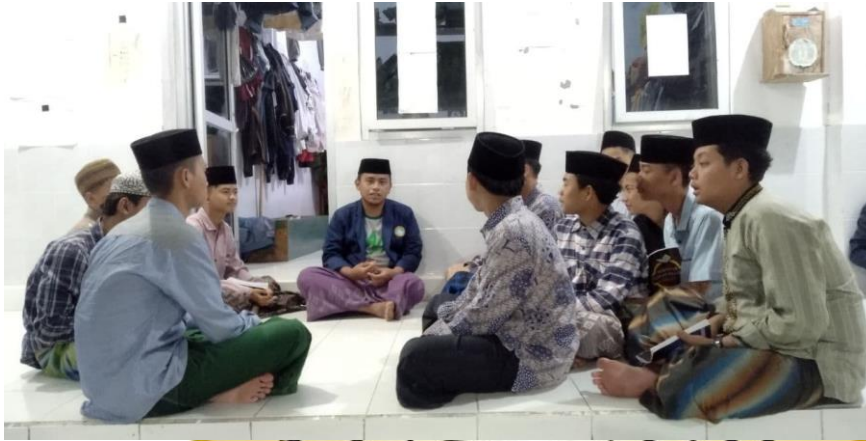
Suasana Santri Pondok Pesantren Nurul Jadid saling berbagi pengalaman dan kehidupan di rumah masing masing.