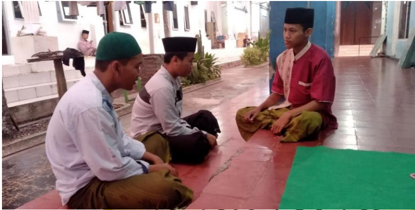
Bimbingan Wali Asuh kepada Anak Asuh kamar D. 09 Wilayah Sunan Kalijaga (D)