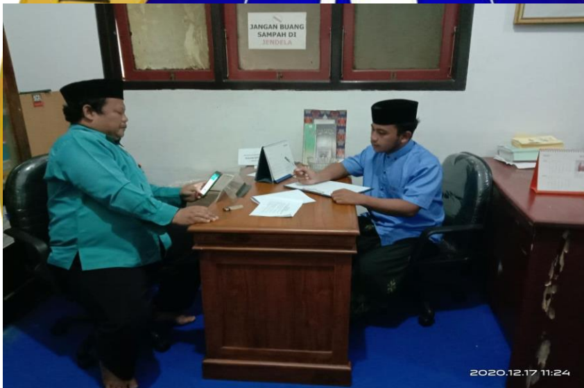
Wawancara dengan Sekretaris Biro Kepesantrenan Pondok Pesantren Nurul Jadid.