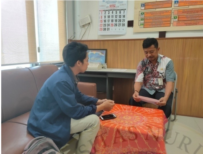
Foto Pengujian Internal dengan Salah Satu Dosen