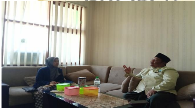
3. Dokumentasi Wawancara dengan Kepala MADIN