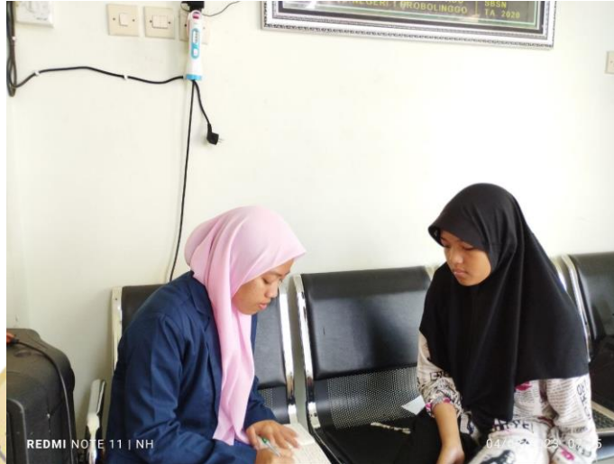
1. Dokumentasi wawancara dengan santri aktif