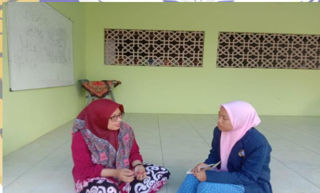
2. Dokumentasi Wawancara dengan salah satu staf Nurul Jadid