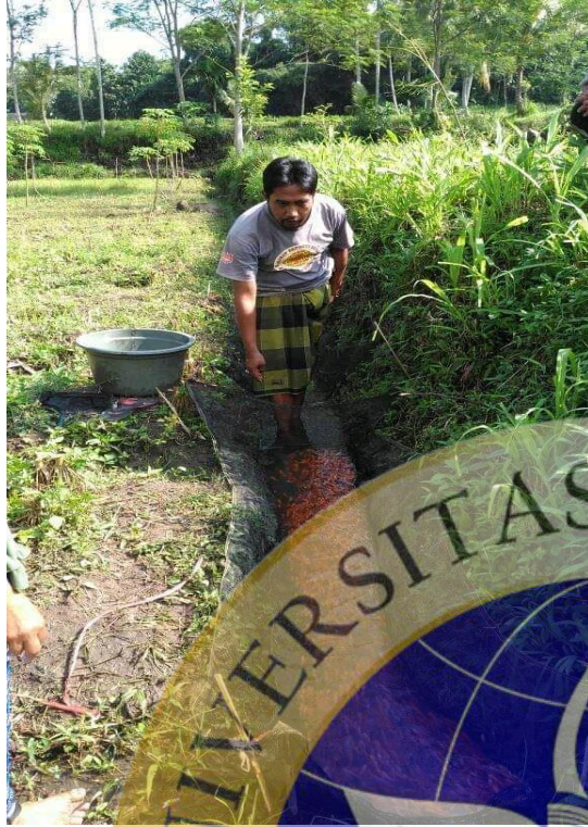
Gambar 9. Ikan Koi Bibit Berumur 3-4 Bulan