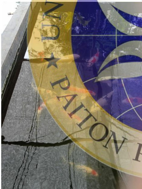
Gambar 8. Ikan Koi Indukan di Toko Ar Royah