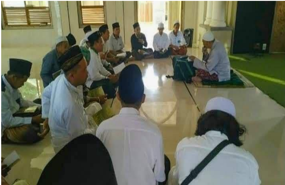
1.1 Dokumentasi kegiatan pengajian kitab bersama Mursyid