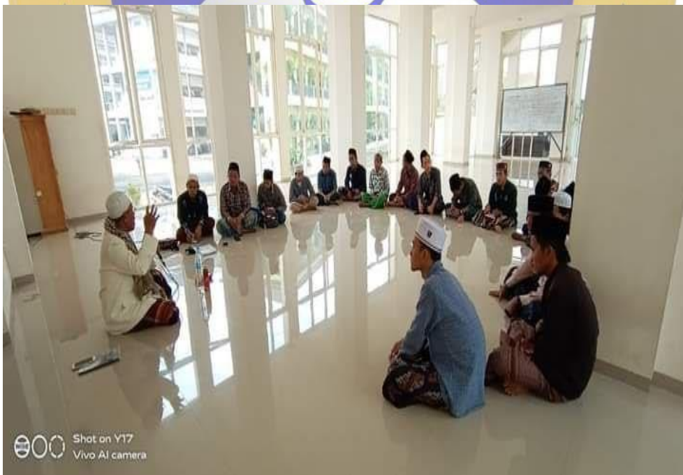
1.2 Dokumentasi kegiatan kajian tasawuf bersama Mursyid