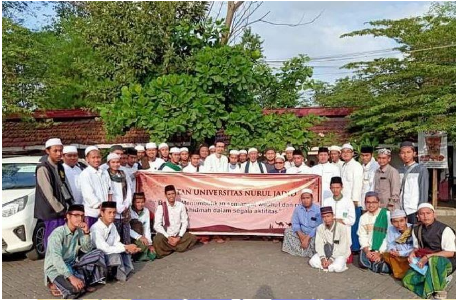
1.3 Dokumentasi kegiatan ziarah wali