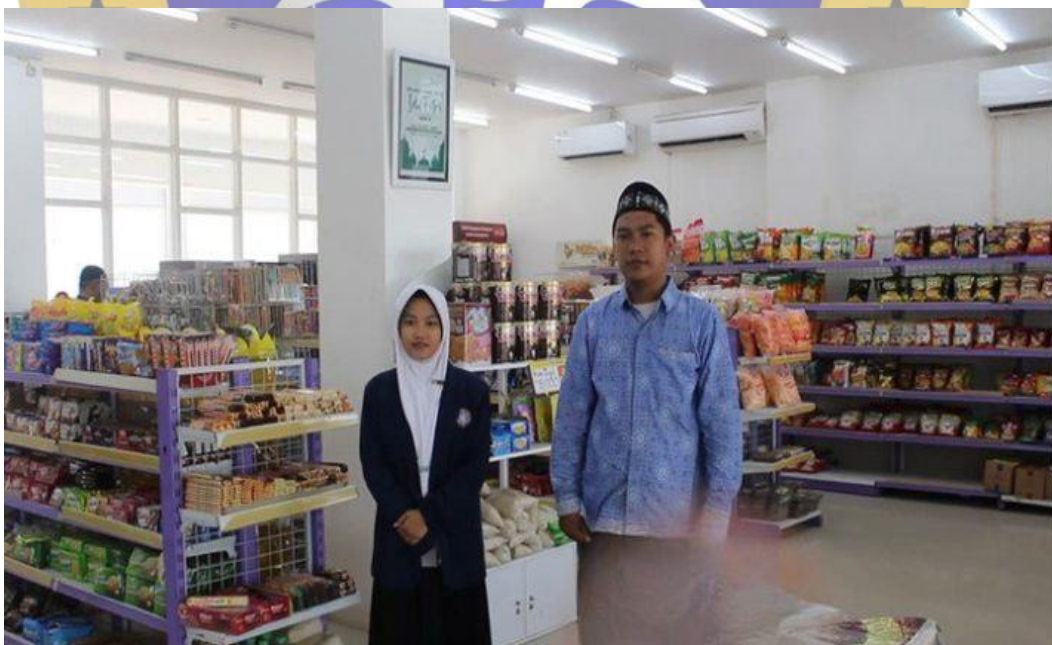
FOTO PENULIS BERSAMA MANAGER ENJE MART