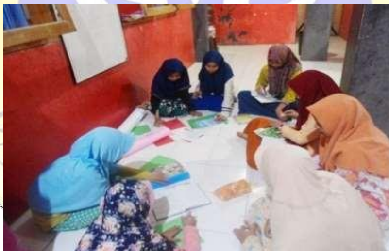
Gambar 2, Pembuatan Majalah Dinding

“Untuk proses pembelajaran mungkin lebih mengandalkan kitab yang berupa cerita ataupun yang bergambar seperti halnya kitab Qiro’atur Rosyidah dan Al-Muthola’ah Al Haditsah. Dengan adanya proses pembelajaran ini cukup membantu peserta didik yang dalam masa transisi dari lembaga yang berbasis kitab menjadi lembaga yang berbasis bahasa tidak hanya dapat memaknai ataupun membaca kitab, namun mereka dapat menuangkan pikiran mereka berupa tulisan yang Berbahasa Arab. Dengan begitu mereka juga dapat mengaplikasikannya dalam pembuatan kalimat, Majalah Dinding, Majalah Halaman Dan Insyah ” 82