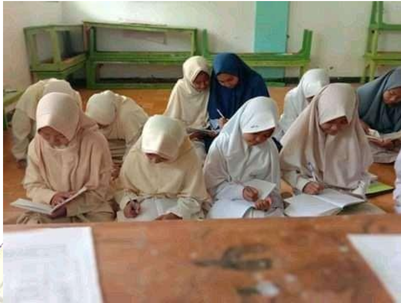
Gambar I, Kursus Pagi Hari

Dari hasil wawancara di atas, saat peneliti bertanya mengenai proses kegiatan dalam meningkatkan maharahkitabah , maka lembaga memiliki dua waktu pembelajaran atau kegiatan, yaitu waktu pagi (kursus) dan malam (kegiatan belajar). Proses pembelajaran untuk meningkatkan Maharah Kitabah ini ialah pada waktu kursus dengan mata pelajaran yang khusus untuk memperdalamnya yaitu dengan mata pelajaran: Bahasa Arab, Muhadatsah , Ilmul Imla' wal Khot dan Naqdu Nushus . Selain itu juga menyediakan dua malam pada kegiatan malam untuk memperdalam pembelajaran ini dengan kegiatan Taghyir adh-Dhoma'ir dan Qiro'atul Kutub .