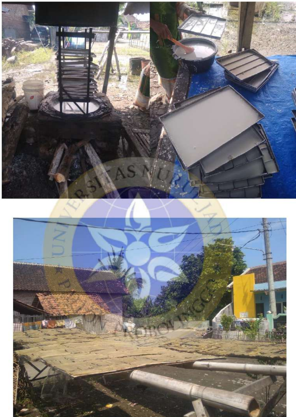
Gambar 5. Foto proses pembuatan kerupuk dan rengginang Azka Jaya.