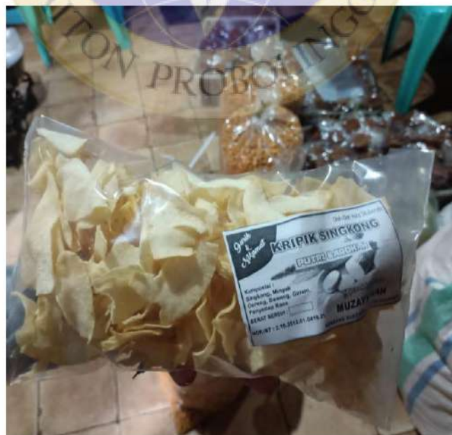
Gambar 4. Foto produk keripik singkong dan Marning Jagung Putri Barokah.