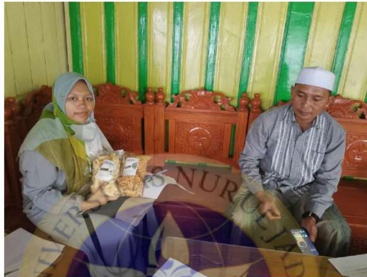
Gambar 1. Foto bersama pemilik Industri olahan pangan keripik singkong dan marning jagung.