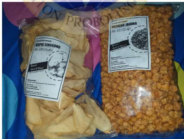
Gambar 2. Foto produk keripik singkong dan marning jagung Ar-Rosidah.