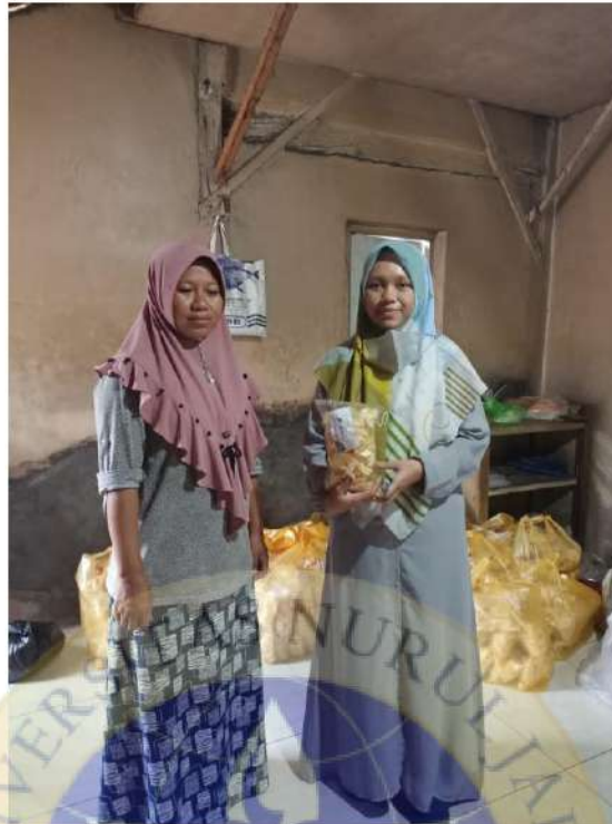
Gambar 3. Foto bersama pemilik industri olahan pangan keripik singkong dan Marning Jagung.