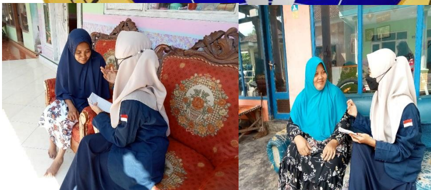
Wawancara dengan salah satu anggota nasabah (Di BMT NU Cabang Grujugan Kabupaten Bondowoso )