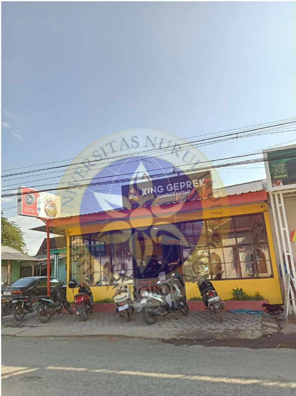
Lokasi Penelitian Usaha King Geprek Sumberanyar