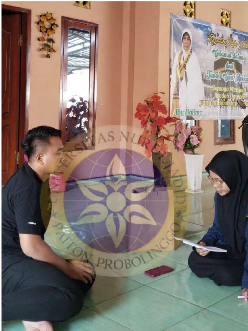
Wawancara Peneliti Dengan Pemilik Usaha King Geprek Sumberanyar