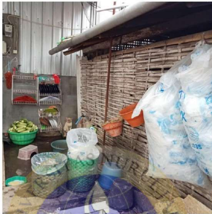
Tempat Pembuangan Limbah Usaha King Geprek Sumberanyar