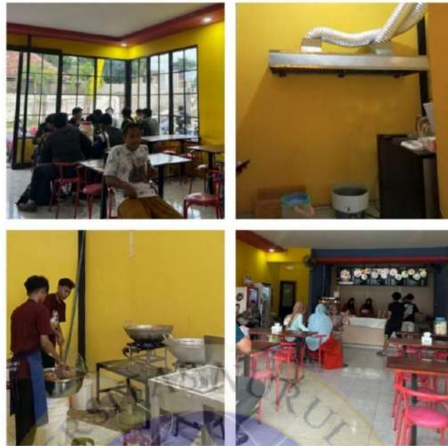
Tempat Makan dan Tempat Produksi Usaha King Geprek Sumberanyar