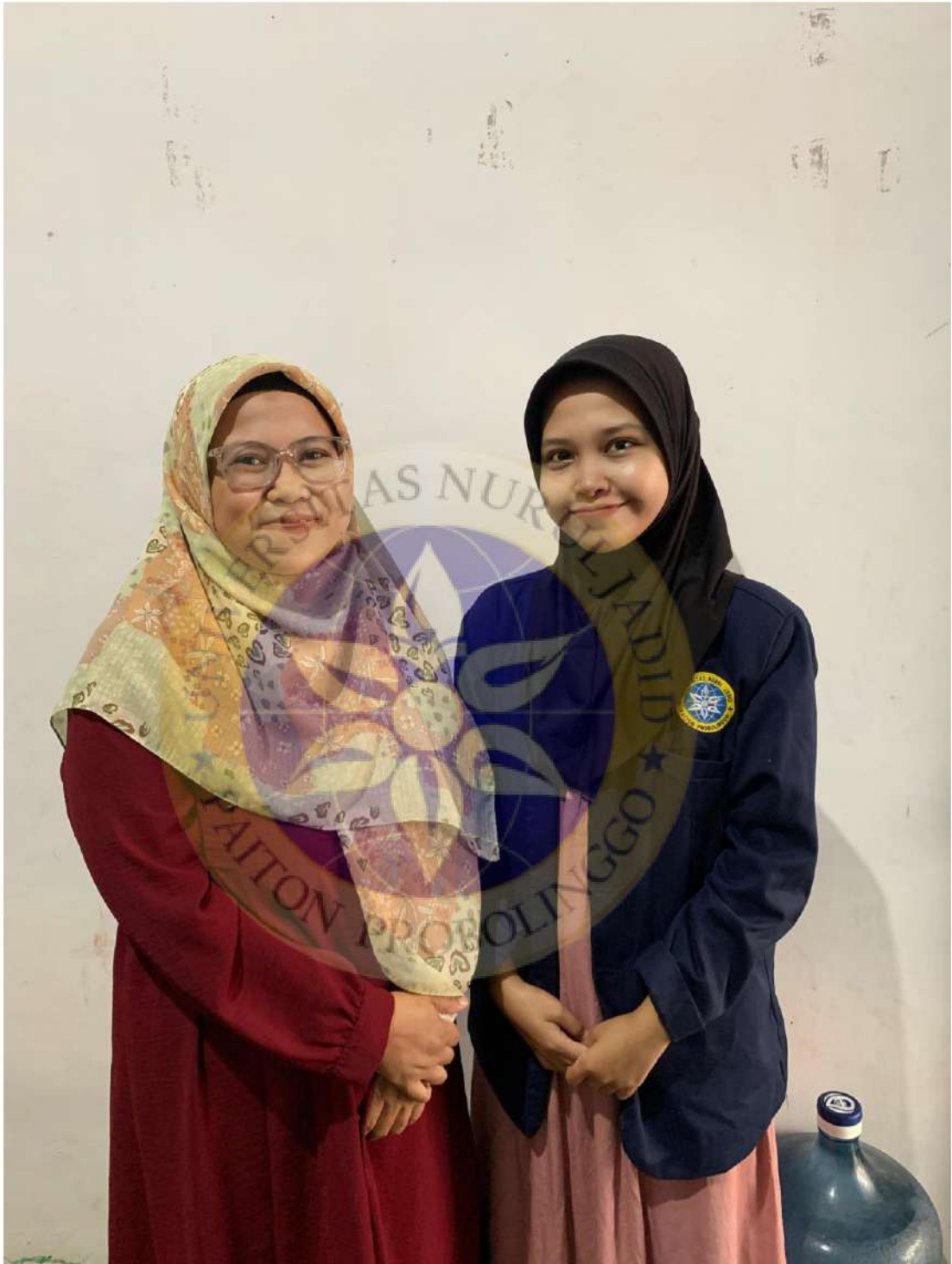
Wawancara Peneliti Dengan Konsumen Usaha King Geprek Sumberanyar