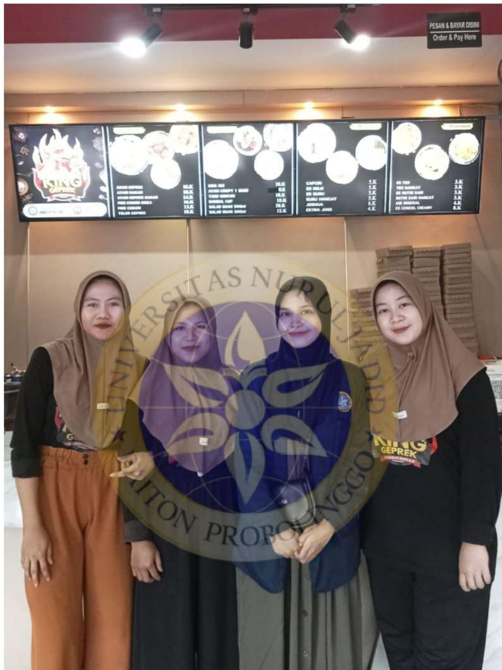
Wawancara Peneliti Dengan Karyawan Usaha King Geprek Sumberanyar