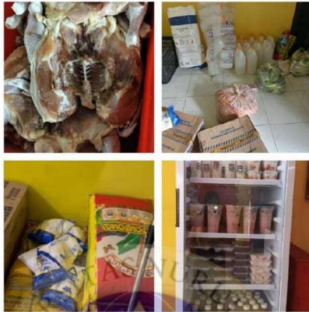
Bahan Baku dan Produk Usaha King Geprek Sumberanyar