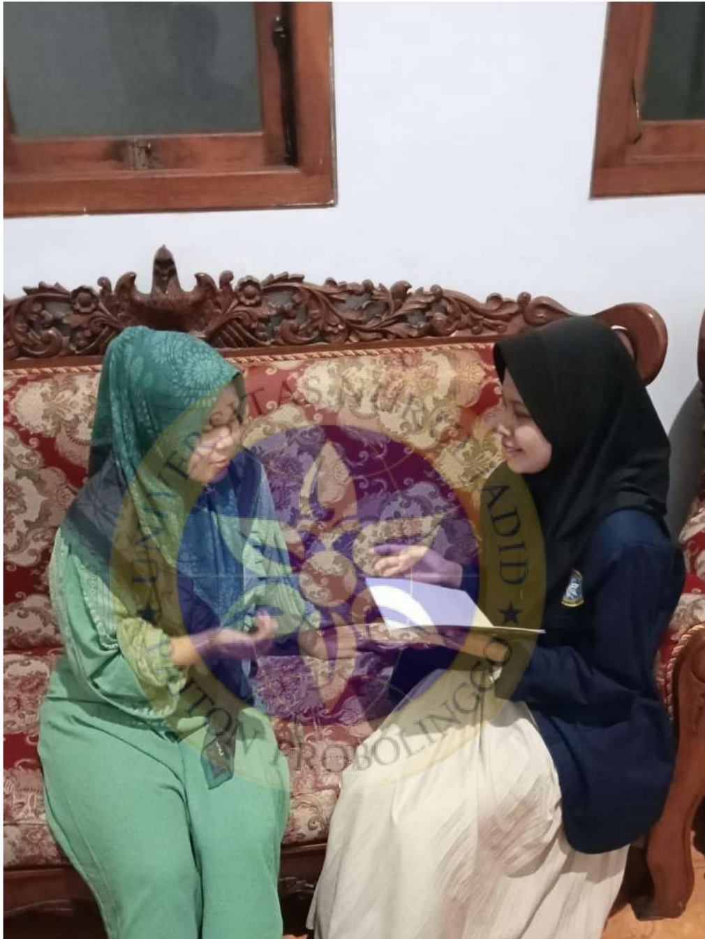
Wawancara Peneliti Dengan Konsumen Usaha King Geprek Sumberanyar