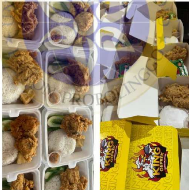
Kemasan Produk Usaha King Geprek Sumberanyar