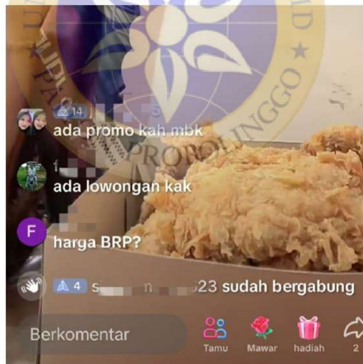
Penggunaan Media Promosi Produk Usaha King Geprek Sumberanyar