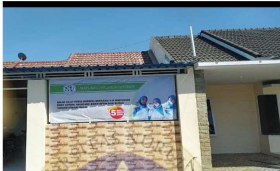
Kantor NU Bodyshop