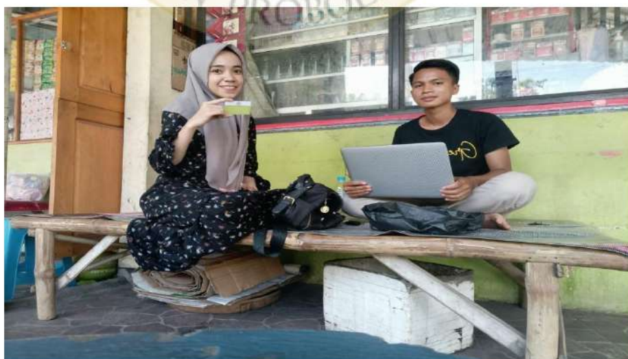
Foto wawancara dengan member atau konsumen tetap NU Bodyshop