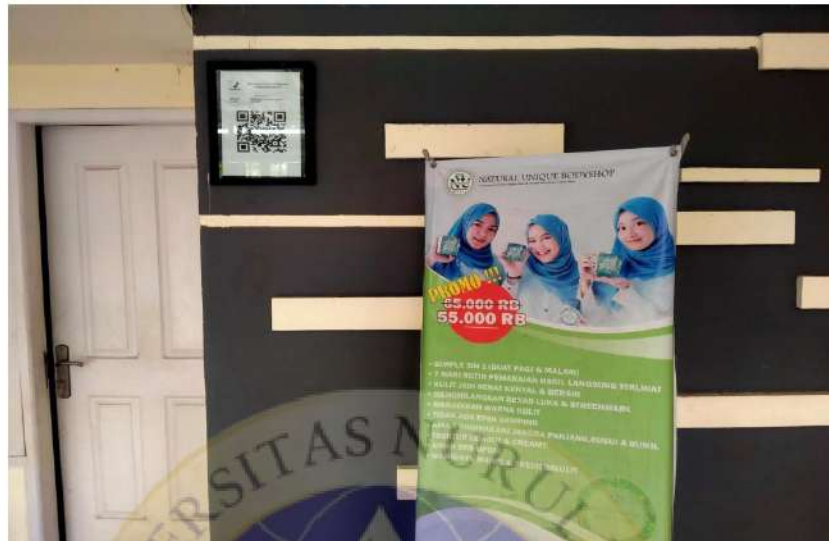
Kantor NU Bodyshop