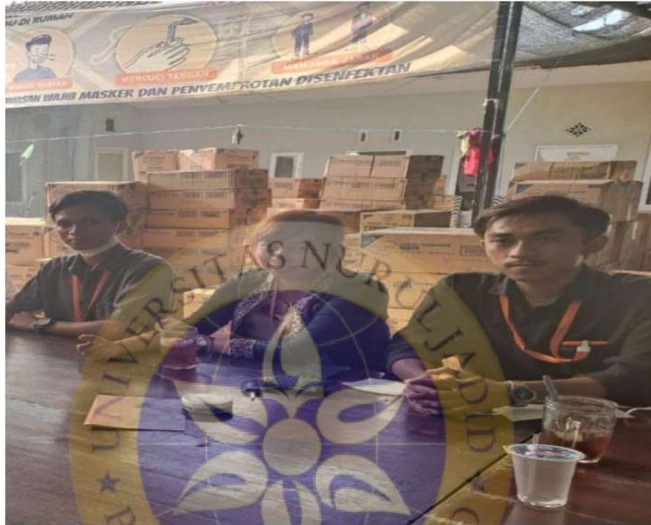
Foto wawancara dengan pemilik dan karyawan pemasaran NU Bodyshop