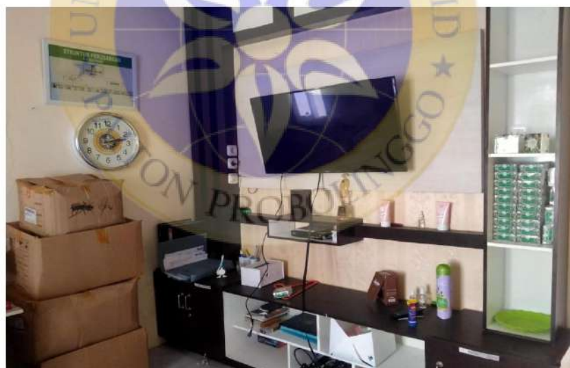
Kantor NU Bodyshop