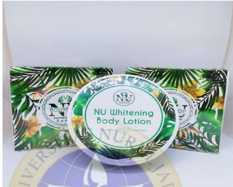
Gambar NU Bodylotion 100 g

Foto dengan member atau konsumen tetap NU Bodyshop