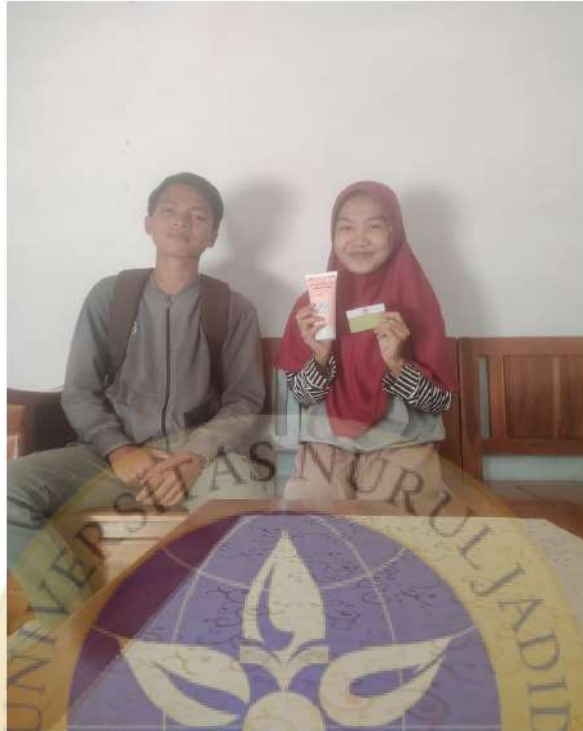
Foto dengan member atau konsumen tetap NU Bodyshop