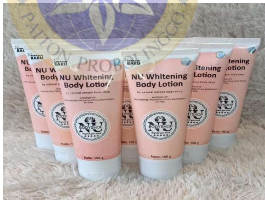
Gambar NU Bodylotion 150g