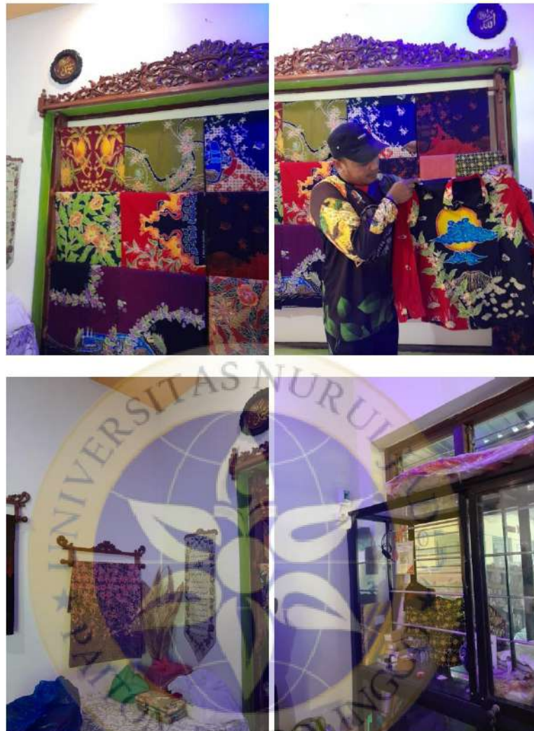
Dokumentasi: Produk Usaha Batik Tulis Sumber Ayu