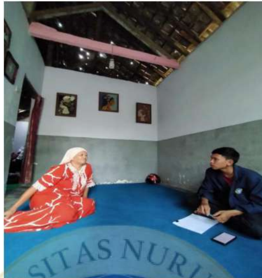
Wawancara dengan pemilik usaha