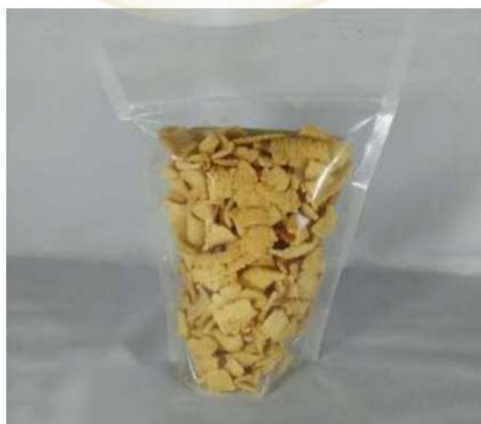
Produk daun kelor