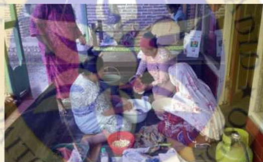
Proses pembuatan kerupuk