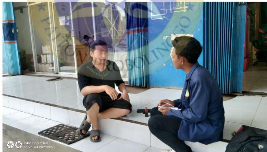
Dokumentasi ke UD. Surya Jaya