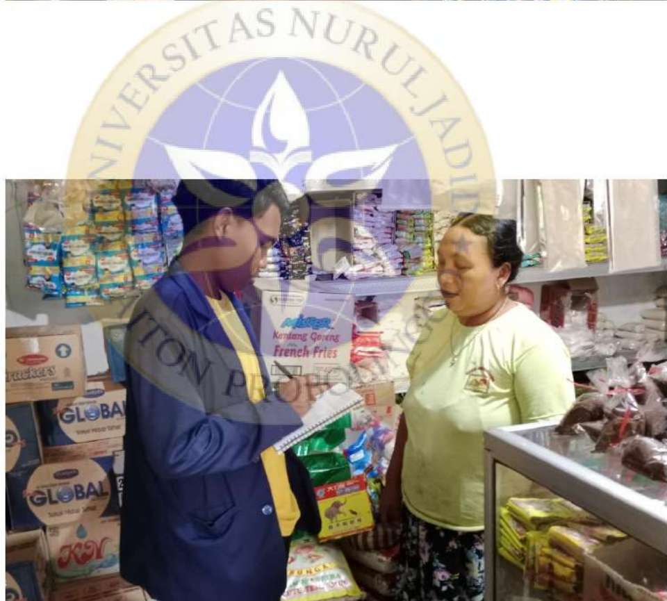
Dokumentasi ke Toko Barokah Pelanggan UD. Surya Jaya.