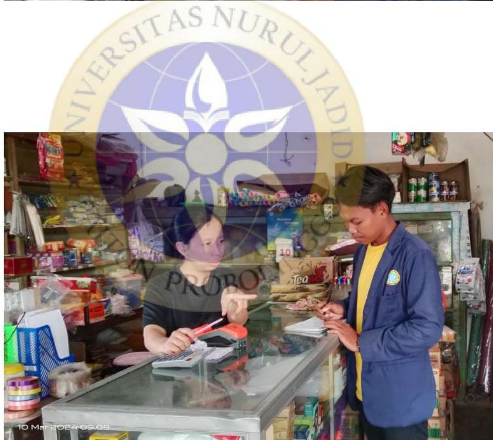
Dokumentasi ke toko Hote pelanggan UD. Surya Jaya