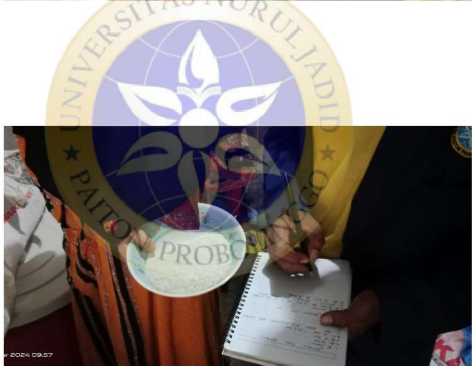
Dokumentasi ke Toko Umi pelanggan UD. Surya Jaya