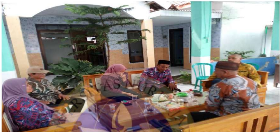
gambar 11 wawancara dengan Bapak Kepala Desa Randutatah