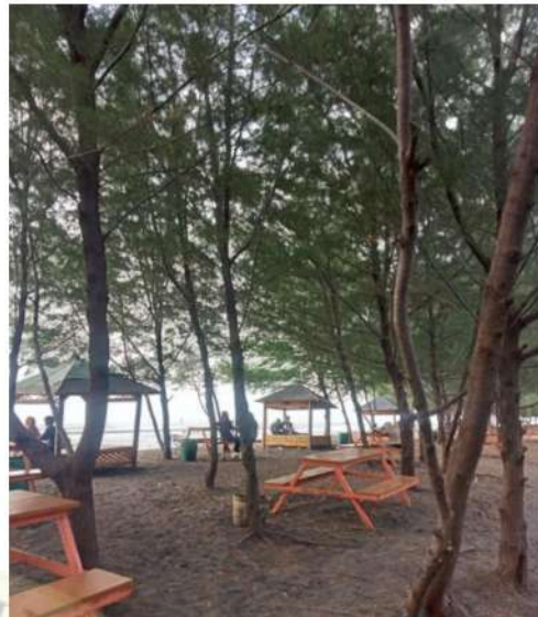
Gambar 4 Kamar Mandi Dan Tempat Duduk Bantuan Dari