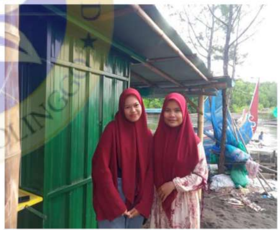
Gambar 4 Wawancara Dengan Salah Satu Warga Desa Randutatah Sekaligus

Penjaga Warung di Pantai Greenthing Beach