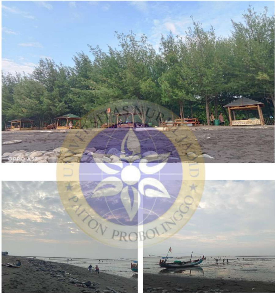
Gambar 6 Pemandangan Pantai Greenthing Beach Ketika Air Laut Surut