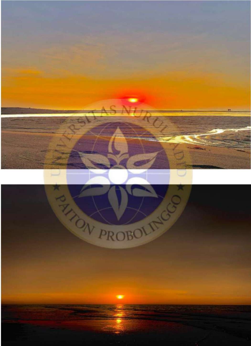
Gambar 7 Pemandangan Greenthing Beach waktu sunset