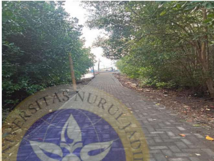
Gambar 1 jalan menuju Pantai Greenthing Beach