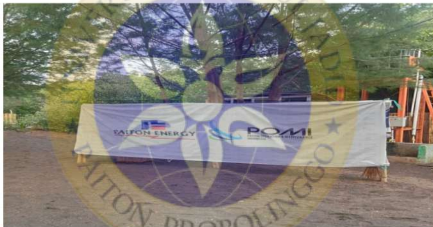
Gambar 4 Kamar Mandi Dan Tempat Duduk Bantuan Dari CSR POMI