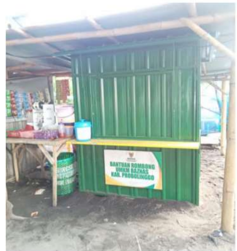
Gambar 3 warung dan rombongan bantuan UMKM