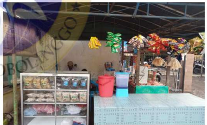
gambar 9 wawancara dengan ibu Jono