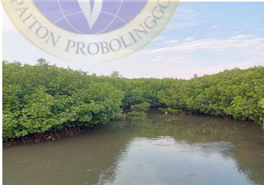
Gambar 2 tempat susur mangrove atau Sungai mangrove