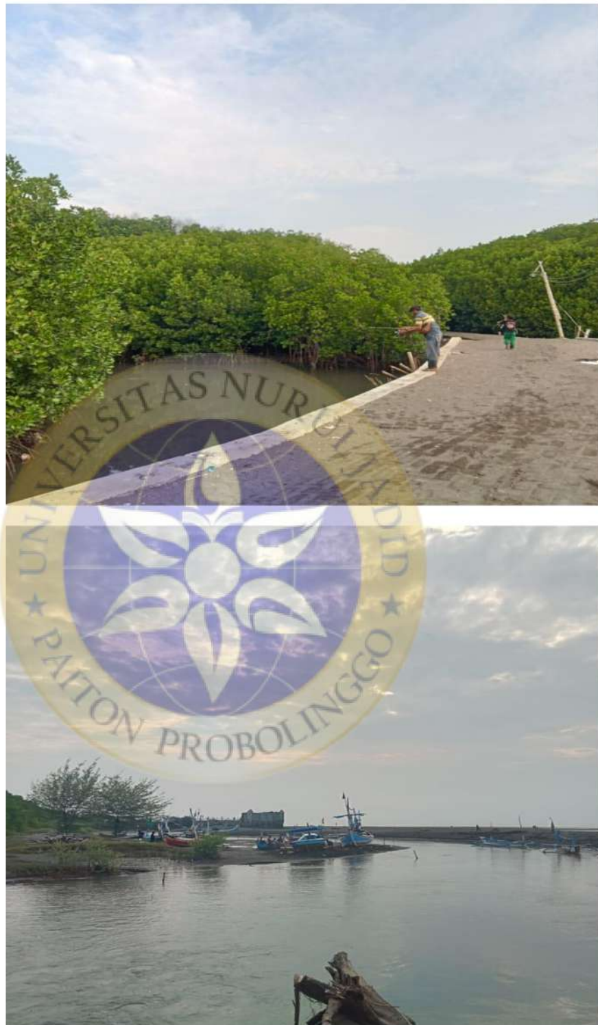
Gambar 5 Tempat para wisatawan memancing