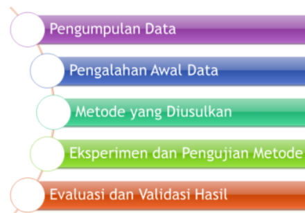
Gambar 3.1 : Tahapan Penelitian

Pada penelitian ini, data mutu padi diolah menggunakan metode data mining sehingga diperoleh satu metode yang paling akurat dan dapat digunakan sebagai rules dalam prediksi kualitas mutu padi. Dalam penelitian ini akan dilakukan beberapa langkah-langkah atau tahapan penelitian seperti yang digambarkan pada gambar 3.1.