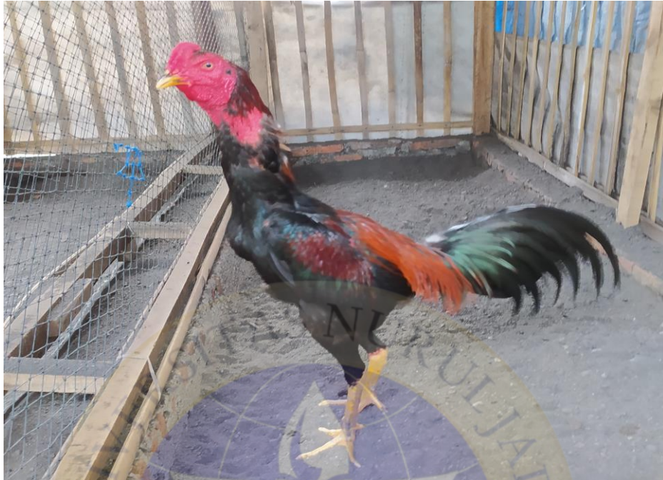
Ayam milik Bapak SG