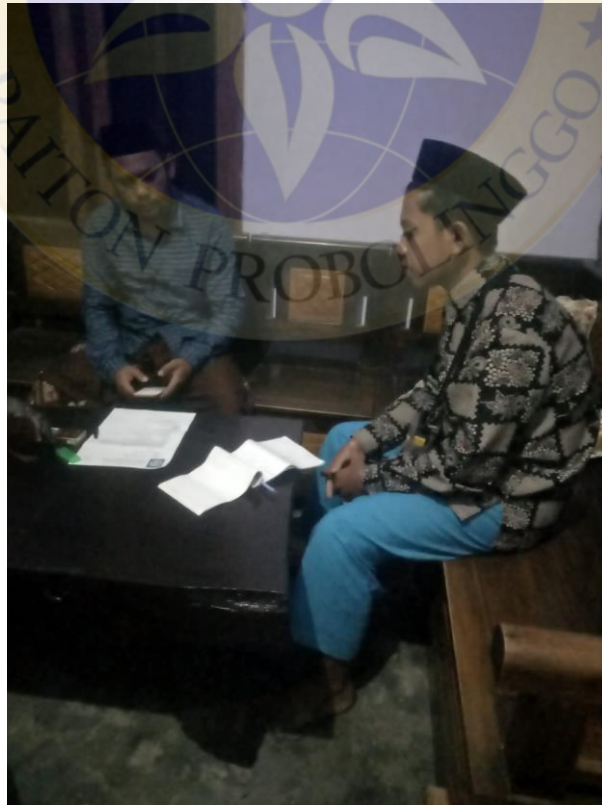
Wawancara dengan Bapak RM Tokoh Masyarakat desa Sumbercanting