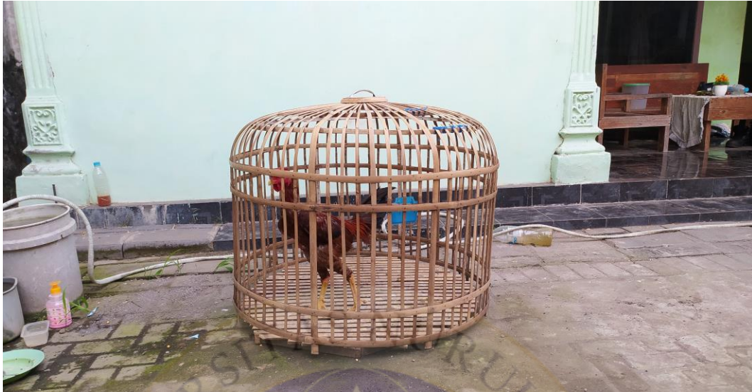
Ayam milik Bapak NR