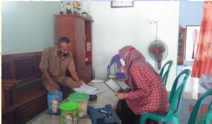
4. Pengujian eksternal dengan operator Desa Kecil