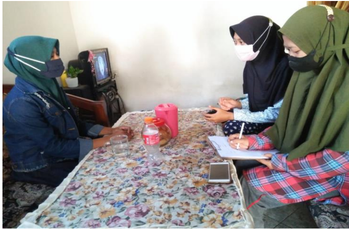
3. Foto bersama kepala desa kecil saat pengujian aplikasi