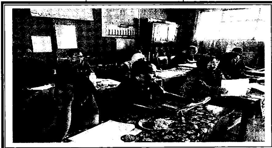
Tampak Peneliti saat bersama Kepala dan dewan guru