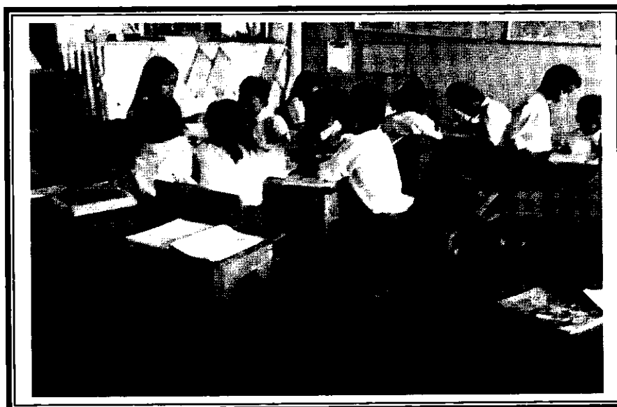
Murid Antusias dan kooperatif dalam kelompok