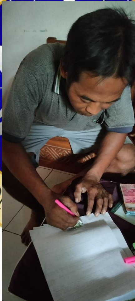
Kegiatan Nasabah Menandatangani Surat Persetujuan Pembiayaan Murabahah