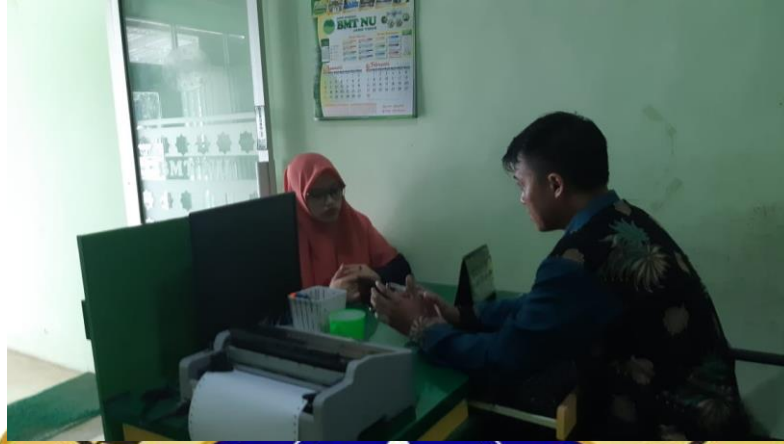
Wawancara dengan Kepala Cabang BMT NU Jawa Timur Cabang Sumberasih Probolinggo