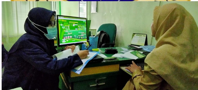
Wawancara dengan Bagian Pembiayaan BMT NU Jawa Timur Cabang Sumberasih Probolinggo