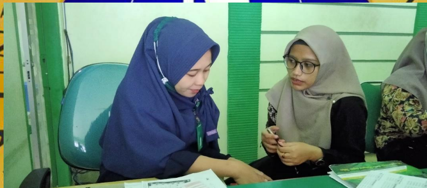
Wawancara dengan Bagian Keuangan dan Administrasi Umum BMT NU Jawa Timur Cabang Sumberasih