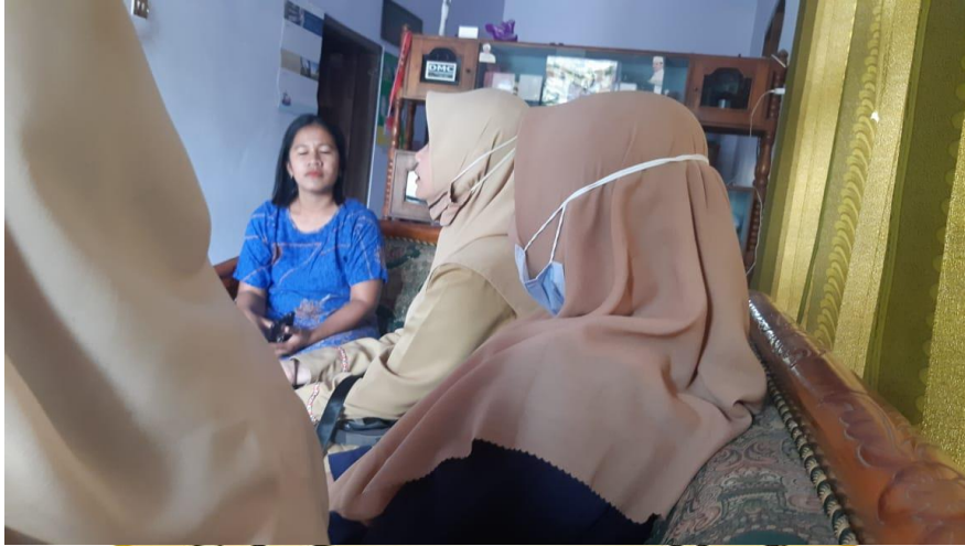
Kegiatan Survei Kelayakan Calon Nasabah Pembiayaan Murabahah