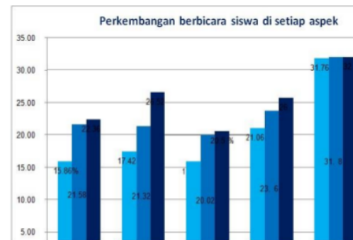
Grafik. 2 Perkembangan berbicara siswa di setiap aspek

Sederhananya, metode ini diterapkan secara objektif untuk mengajar siswa di area berbicara; itu memberikan beberapa kontribusi untuk mengembangkan kompetensi siswa terutama ketika itu diterapkan di SMP Nurul Jadid. Siswa sekarang benar-benar menikmati untuk berlatih percaya diri dengan menggunakan ucapan bahasa Inggris. Oleh karena itu, penulis, tentu saja, dapat menyimpulkan bahwa metode CLL dapat mempengaruhi masalah serius siswa.