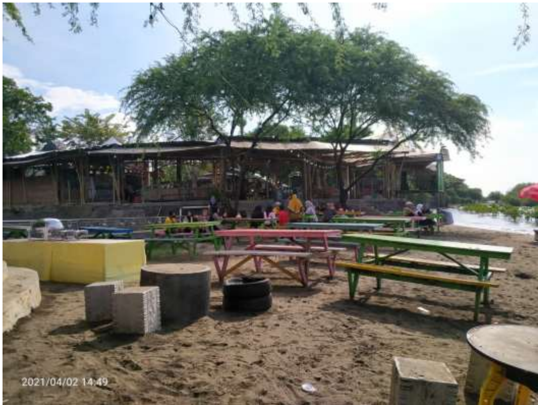
Suasana disekitar Pantai Bohay