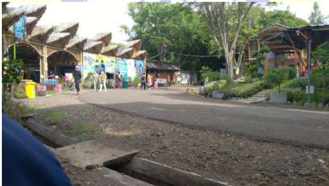
Caffe dan Resto pantai Bohay