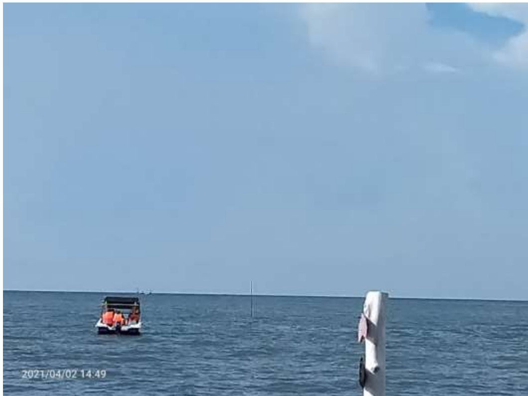
Wisata Snorkling Pantai Bohay