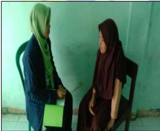
Wawancara dengan siswi