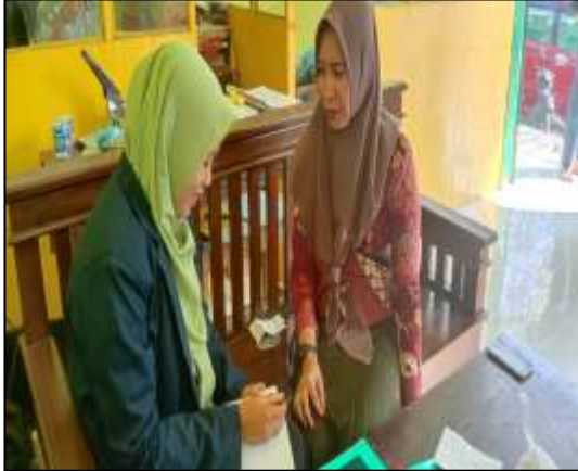
Wawancara dengan Guru Akidah Akhlak