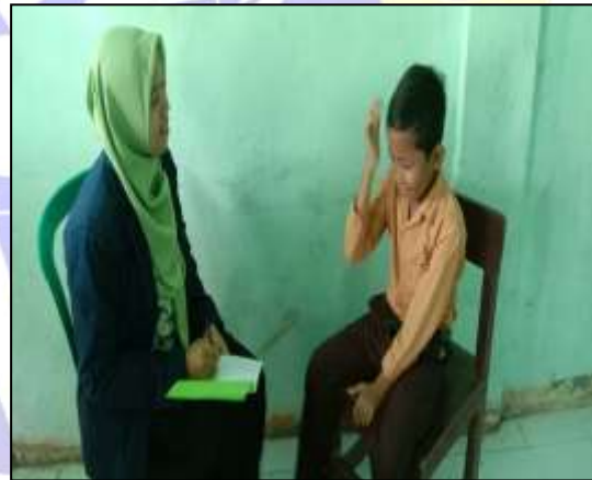
Wawancara dengan siswa