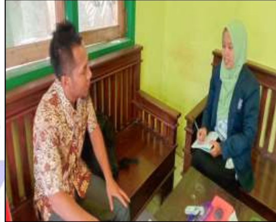
Wawancara dengan Kepala Madrasah