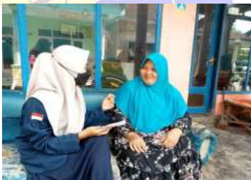
WAWANCARA KEPADA SALAH SATU NASABAH BPRS SITUBONDO