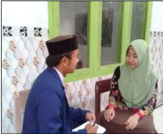
Wawancara dengan Guru Akidah Akhlak