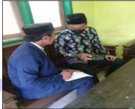
Wawancara dengan Kepala Madrasah