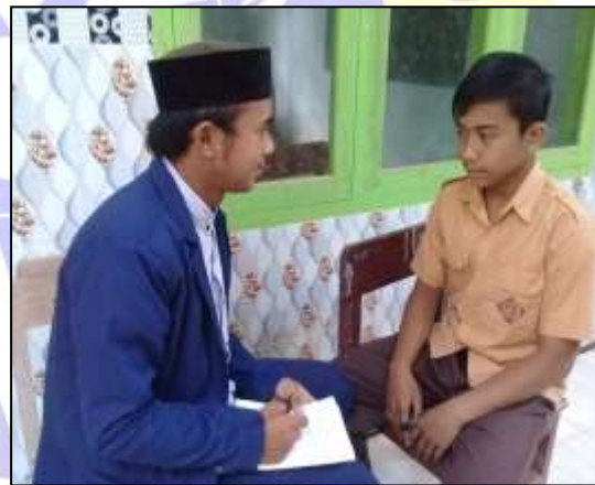
Wawancara dengan siswa