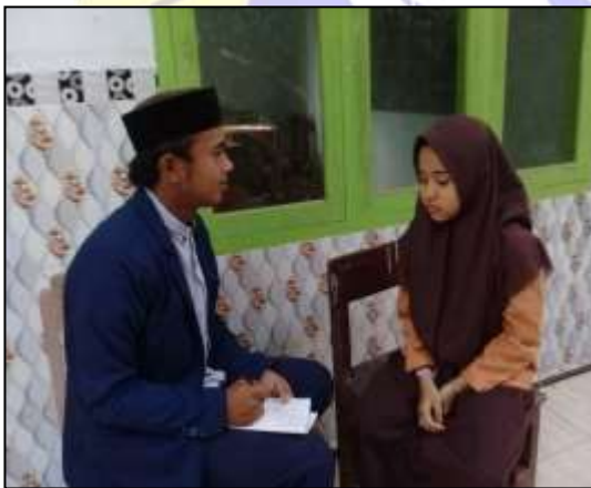
Wawancara dengan siswi