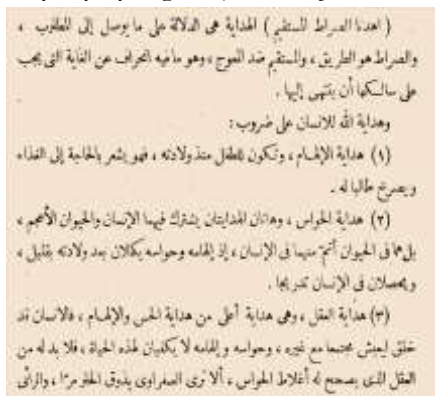
Teks Tafsir al-Marāghī yang ditulis pada tahun 1950 M.