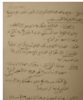
Teks Tafsir bi al-Imlā' Kyai Zaini yang ditulis pada tahun 1973 M.

Dari teks di atas, sekilas memang terdapat kesamaan walaupun dalam beberapa hal banyak perbedaan. Misalnya, al-Marāghī dalam tafsirnya membagi hidayah, ketika menafsirkan ayat ibdinā al-ṣirāṭ al-mustaqīm ke dalam empat bagian; hidāyat al-ilhām , hidāyat al-ḥawās , hidāyat al-'aql dan hidāyat al-adyān wa al-sharā'i . Pembagian ini juga terdapat dalam tafsir Kyai Zaini dengan penjelasan dan gaya bahasa yang hampir sama. Gaya bahasa Kyai Zaini dalam