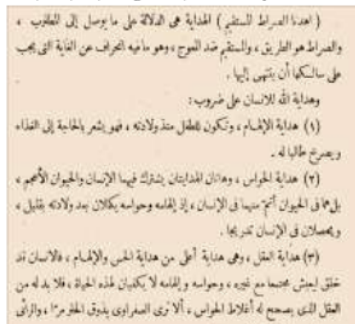
Teks Tafsir al-Marāghī yang ditulis pada tahun 1950 M.