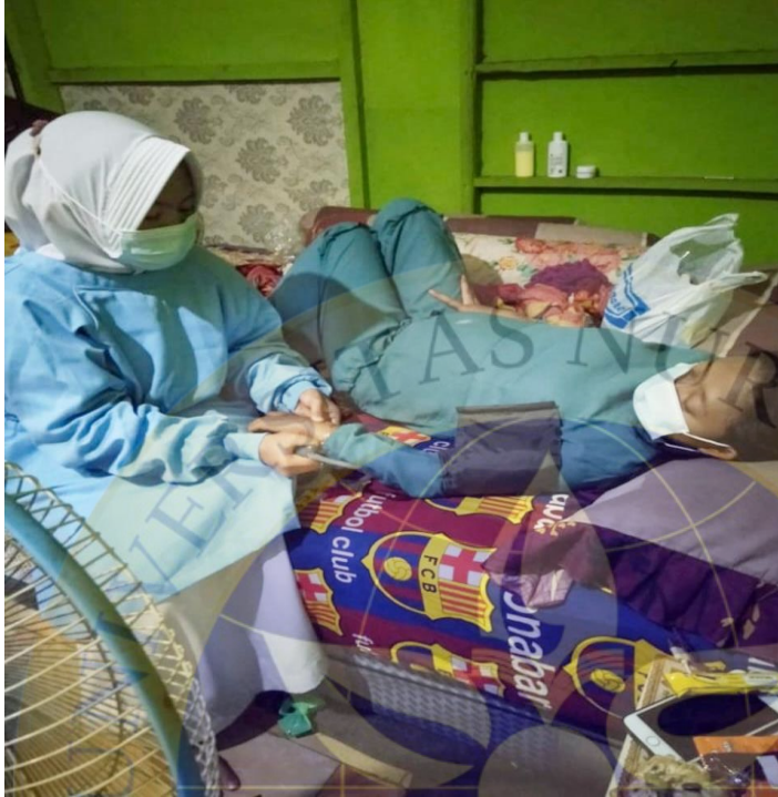
Lampiran 10 dokumentasi kunjungan ANC