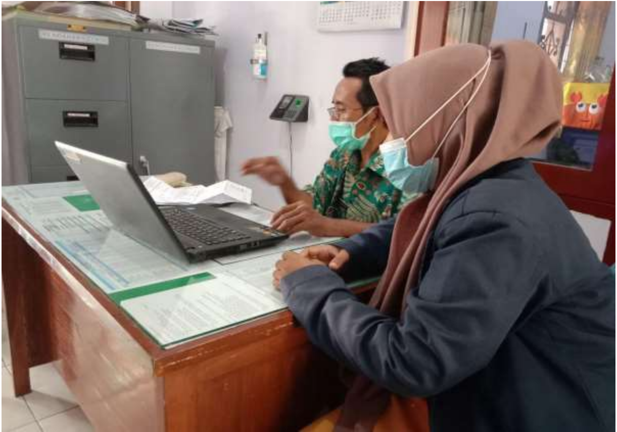
Lampiran 7 Penelitian