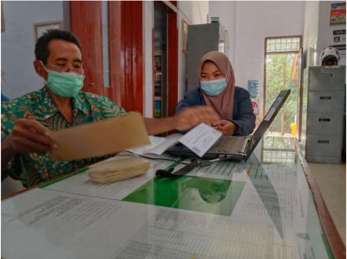
Lampiran 9- Penelitian Lanjutan