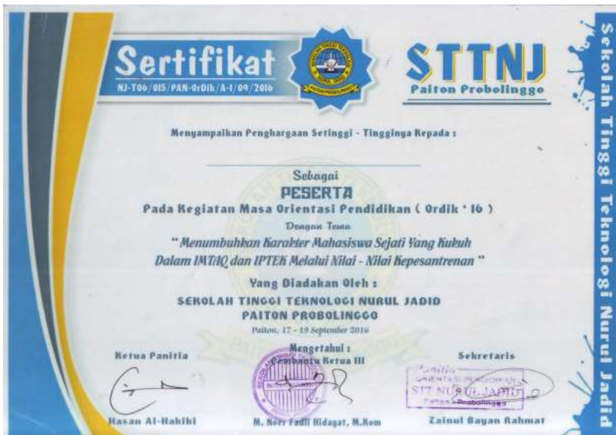
Lampiran 6- Sertifikat Ordik16