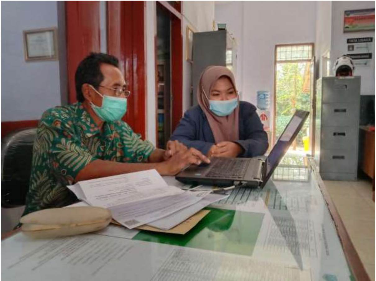
Lampiran 8: Penelitian Lanjutan