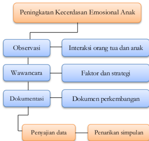
Gambar 2. Desain dan Alur Penelitian

6 Pengumpulan data menggunakan teknik observasi wawancara dan studi dokumentasi. Observasi digunakan untuk mengamati aktivitas interaksi orang tua dan anak di lokasi penelitian, sementara wawancara digunakan untuk mendalami faktor dan strategi peningkatan kecerdasan emosional anak. Sedangkan dokumentasi digunakan untuk melihat dokumen-dokumen berkaitan dengan peningkatan kecerdasan emosional, baik yang dimiliki oleh orang tua ataupun yang tersebar di lingkungan desa. Untuk analisa data menggunakan alur 6 reduksi data, penyajian data dan penarikan simpulan. Dan untuk menjamin keabsahan data dilakukan triangulasi data, baik antar data dengan data, dan antar sumberdata dengan sumber data. Secara bagan desain penelitian berikut ini: