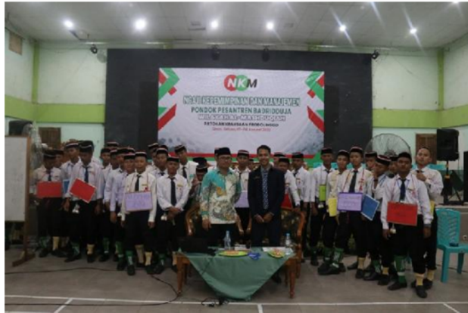
Gambar 5. Mini Workshop Kepemimpinan dan Manajemen bagi pengurus ISMAH

Pelaksanaan pengabdian masyarakat ini memberikan kontribusi baik bagi terpecahkannya problematika yang dihadapi oleh pengurus ISMAH, namun demikian tindakan selanjutnya masih membutuhkan penguatan-penguatan lanjutan yang dilakukan oleh tim-tim pengabdian lainnya agar terus berjalan secara sirkulatif mengingat kondisi SDM yang selalu berganti-ganti dalam setiap tahunnya dan bersifat pembekalan, serta kondisi lingkungan yang selalu berubah-ubah.