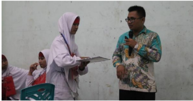
Gambar 4. Dinamika dan Sharing Teori dan Praktek dalam ber-organisasi.

Implikasi kegiatan ini berjalan secara dialogis, diikuti oleh semua peserta secara bergantian sehingga tercipta suasana kekeluargaan, kekompakan, kesigapan dalam menjalankan program kerja berdasarkan kasus pada masing-masing bagian. Selain itu tercipta jalinan relasi yang baik, peningkatan pengetahuan keorganisasian, dan terwujudnya pemahaman tentang garis instruksi dan koordinasi yang baik dalam berorganisasi, fungsi job description dan SOP yang telah disusun.