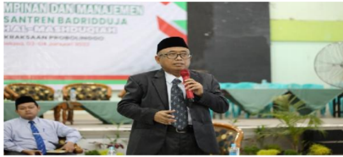
Gambar 3. FGD Analisis SWOT Tim Pengabdian Masyarakat 5

Setelah FGD tentang analisis SWOT selesai, maka dilanjutkan dengan kegiatan 5 mencari literatur yang relevan dengan masalah yang dihadapi pengurus ISMAH khususnya dan solusi atas permasalahan secara teoritis dan praktis sebagai tindakan problem solving . Fokus materinya adalah tentang kepemimpinan dan manajemen. Kegiatan dilaksanakan bersama-sama dengan para tim pengabdian masyarakat, dengan cara menelaah beberapa buku yang relevan untuk diimplementasikan pada kegiatan praktis menjalankan program organisasi yang sesuai dengan sistem yang berlaku di Pondok Pesantren Badridduja Wilayah Al-Mashduqiah.