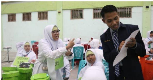
Gambar 2. Survei dan FGD Tim Pengabdian Masyarakat

Kegiatan ini dilaksanakan oleh semua tim yang terdiri atas 5 orang pengabdian masyarakat bersama dengan seluruh pengurus organisasi santri, pada tanggal 10 Mei 2022 jam 08.00 di Aula Pondok Pesantren Badridduja wilayah Al-Masduqiah Probolinggo.