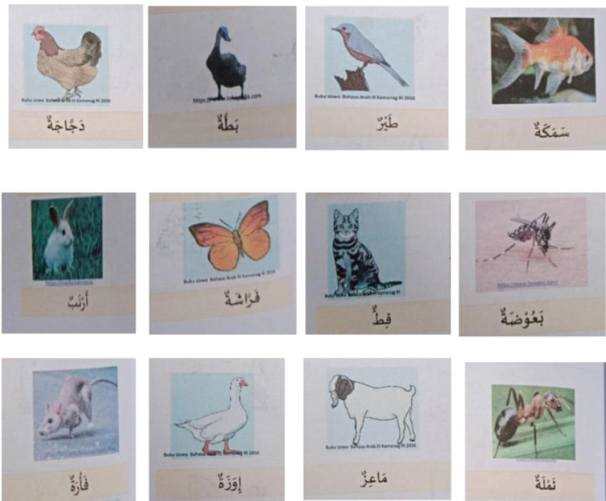
Gambar 4: Media Kartu Flashcard

Pada pertemuan ketiga peneliti melakukan pengulangan kosa kata yang telah diberikan pada minggu sebelumnya dan ketika siswa sudah menghafal kosa kata tersebut, lalu kita memberikan kosa kata yang baru tentang hewan.