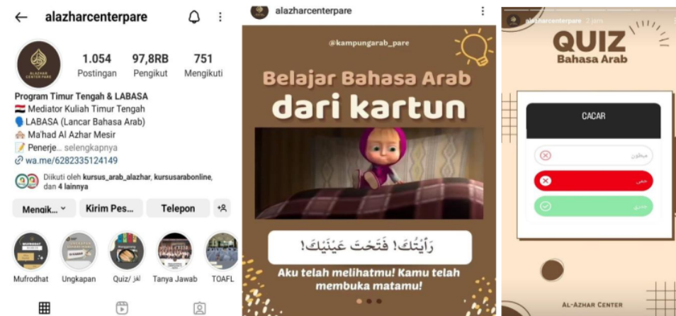
Gambar 2 tampilan profil @alazharcenterpare

Sama seperti akun sebelumnya, @alazharcenterpare adalah akun dari lembaga kursus bahasa Arab Al-azhar yang bertempat di Pare Kediri (lihat gambar 2). Tidak jauh beda dengan akun sebelumnya, akun ini juga memuat hal-hal yang berkaitan dengan bahasa Arab.