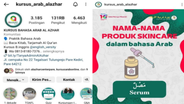
Gambar 1 tampilan profil @kursus_arab_alazhar

Akun @kursus_arab_alazhar memuat konten-konten seputar bahasa Arab, baik itu berupa gambar atau video yang diunggah pada feeds atau story untuk melatih keterampilan berbahasa Arab (lihat gambar 1). Akun ini merupakan akun dari salah satu lembaga kursus bahasa Arab yang ada di Pare Kediri.