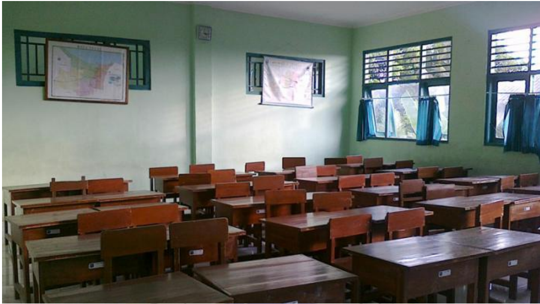
Lampiran 5. Foto Observasi