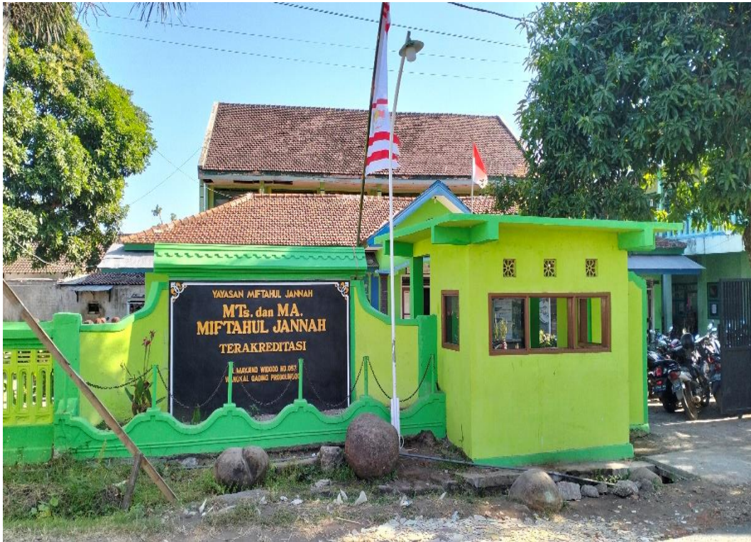
Gambaran MA Miftahul Jannah Wangkal