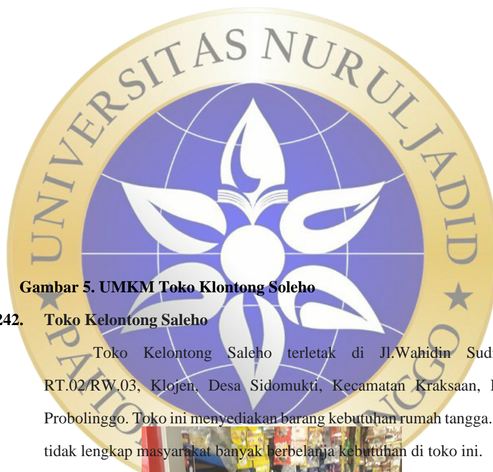
Gambar 5. UMKM Toko Klontong Soleho

makan di tempat saja, kini konsumen bisa memesan aneka macam farian bakso lewat online tanpa adanya ongkir. Dengan adanya modal dan inovasi baru tersebut. Bakso Rusuk Mandala kini mendapatkan perkembangan dalam omset penjualannya. Yang biasanya mendapatkan Rp.800.000 kini mendapatkan Rp.1.500.000 perharinya.