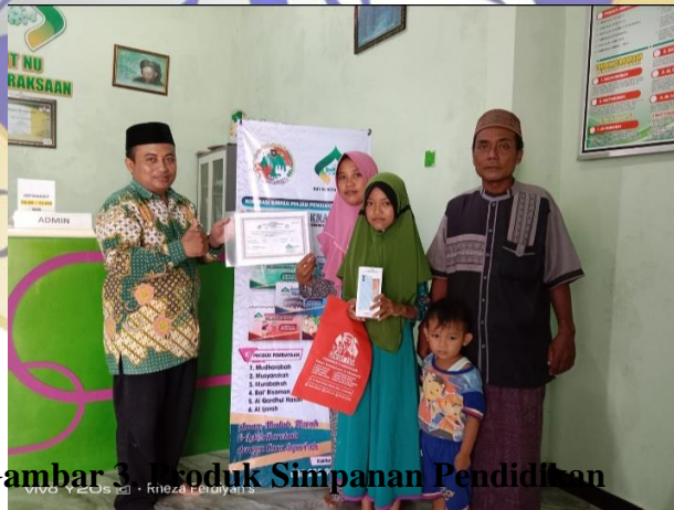
Gambar 3. Produk Simpanan Pendidikan

Simpanan pendidikan adalah suatu bentuk simpanan nasabah yang mana simpanan ini tidak bisa di tarik kecuali anaknya sudah naik kelas dan membutuhkan dana untuk kepentingan pendidikan anaknya tersebut. Simpanan pendidikan ini sangat bagus untuk nasabah yang mempunyai rencana untuk menyekolahkan anaknya ke jenjang pendidikan yang lebih