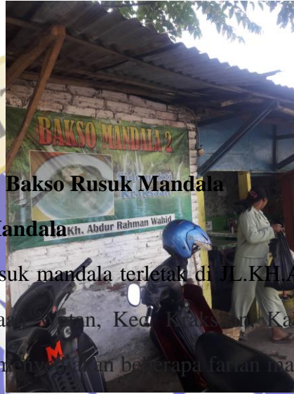
Gambar 4. UMKM Bakso Rusuk Mandala

Adapun contoh UMKM yang ada di Desa Sidomukti sebagai berikut :