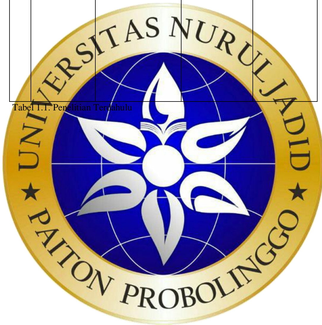
Tabel 1.1. Penelitian Terdahulu